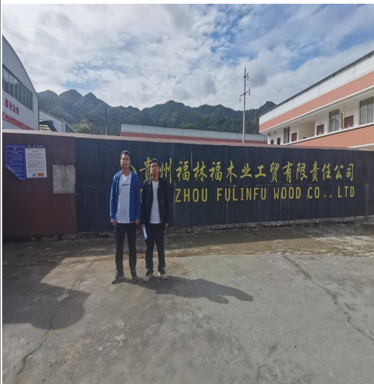
现场调查合影照片