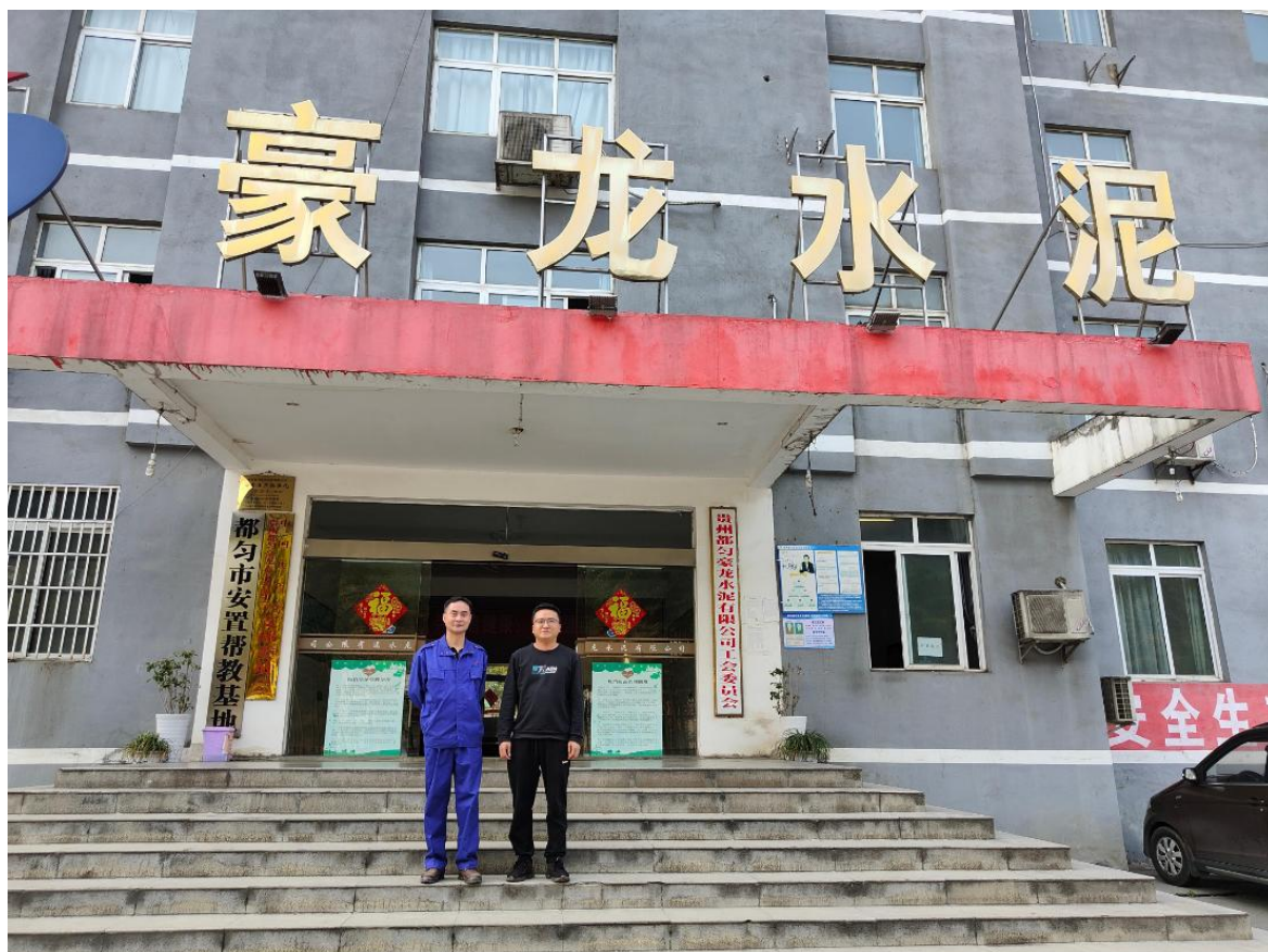
现场采样及检测员