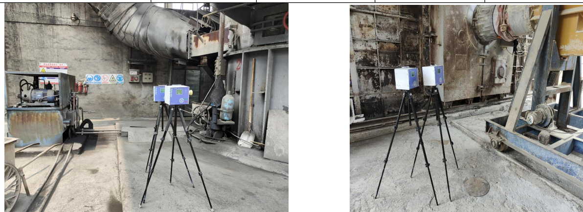
现场采样及检测照片