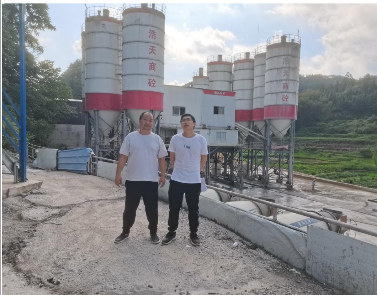
现场调查合影照片